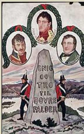
Eidsvollsseden, postkort fra 1914

Kapittel tittelen viser til Eidsvollsseden avlagt på riksforsamlinga i 1814. Deltakerne sverget da å være «enig og tro til Dovre faller», med andre ord til evig tid.