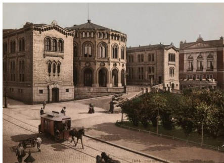
Stortinget, postcard from the 1890s

after the very same Charles John who negotiated the terms of the Swedish-Norwegian Union of 1814 and in 1818 became the union's second king.