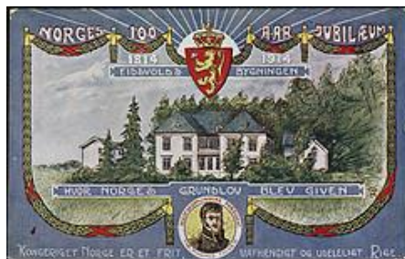
Eidsvollsbygningen, postkort fra 1914, Nasjonalbiblioteket

verk i Akershus som tilhørte Christian Fredriks venn, Carsten Anker (1747-1824), embetsmann og politiker.