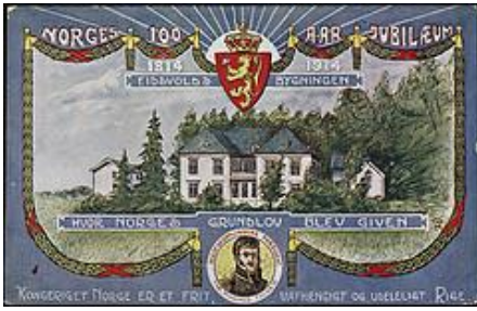
Eidsvoll Manor, postcard from 1914

At the assembly Christian Frederick was elected king of an independent Norway. The Eidsvoll Men, as they are known, furthermore authored the Norwegian Constitution, inspired by ideas from the Revolutionary period and the American Constitution of 1789. This edition is known as the May 17 th Constitution as this was the day when the document was signed, and this is the reason why Norway celebrates its National Day on May 17 th .