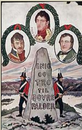
The Eidsvoll oath, postcard from 1914

The chapter title references the Eidsvoll oath taken by the constituent assembly in 1814. Dovre refers to the Dovrefjell mountain range as a symbol of the eternal and The Eidsvoll Men swore to stay “faithful and united until Dovre falls” i.e. until the end of time.