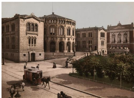
Stortinget, postkort fra 1890-tallet, Nasjonalbiblioteket

Norges nasjonalforsamling Stortinget ble etablert med grunnloven i 1814 og ligger på Oslos paradegate Karl Johan, oppkalt etter den samme Karl Johan som forhandlet fram unionen mellom Norge og Sverige og ble unionens andre konge i 1818.